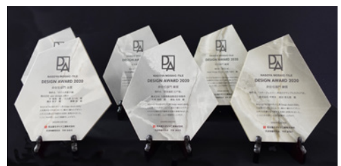
タイルの盾/写真は2020年のもの。タイル「ジェイダイト」