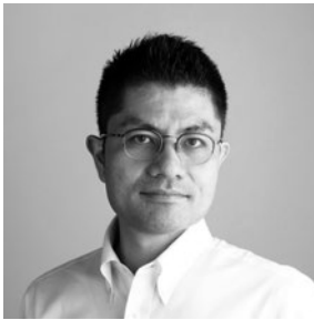
猪熊 純 氏 (建築家)

東京都立大学助教/成瀬・猪熊建築設計事務所主宰。主な作品に、「豊島八百万ラボ」「Dance of light」「LT城西」など。JID AWARDS大賞、第15回ヴェネチア・ビエンナーレ国際建築展 特別表彰など受賞多数。